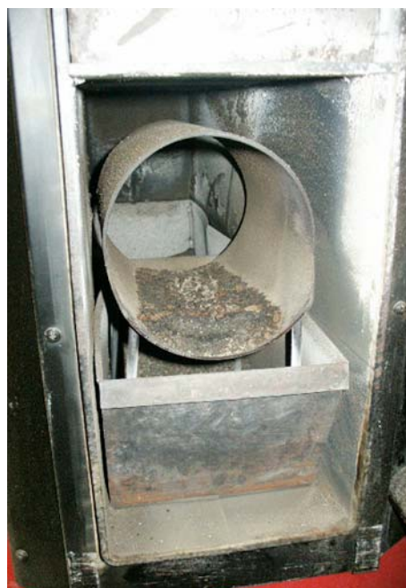
Efterbrännkammaren monterad i asklådan.